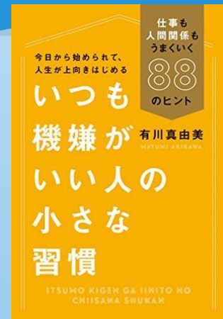
いつも機嫌が いい人の 小さな習慣