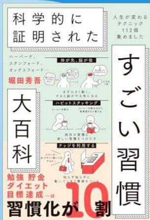
科学的に証明された すごい習慣 大百科